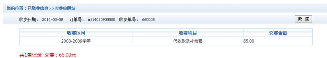
图 3.4-2 已缴费明细