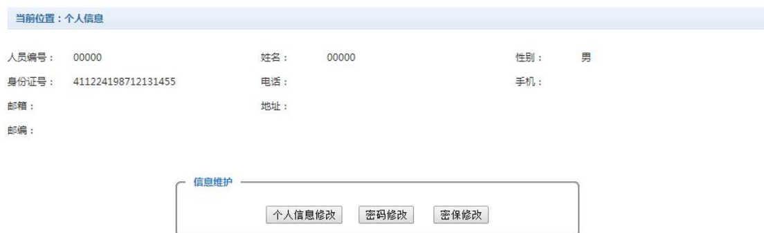
图 2-1 个人信息维护界面

登陆支付平台后，点击导航栏的个人信息按钮，显示个人信息确认及维护界面。如图 2-1 所示。 请确认个人信息无误后再进行缴费，避免误交费。