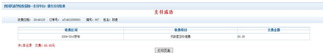
图 3.1-6 支付成功