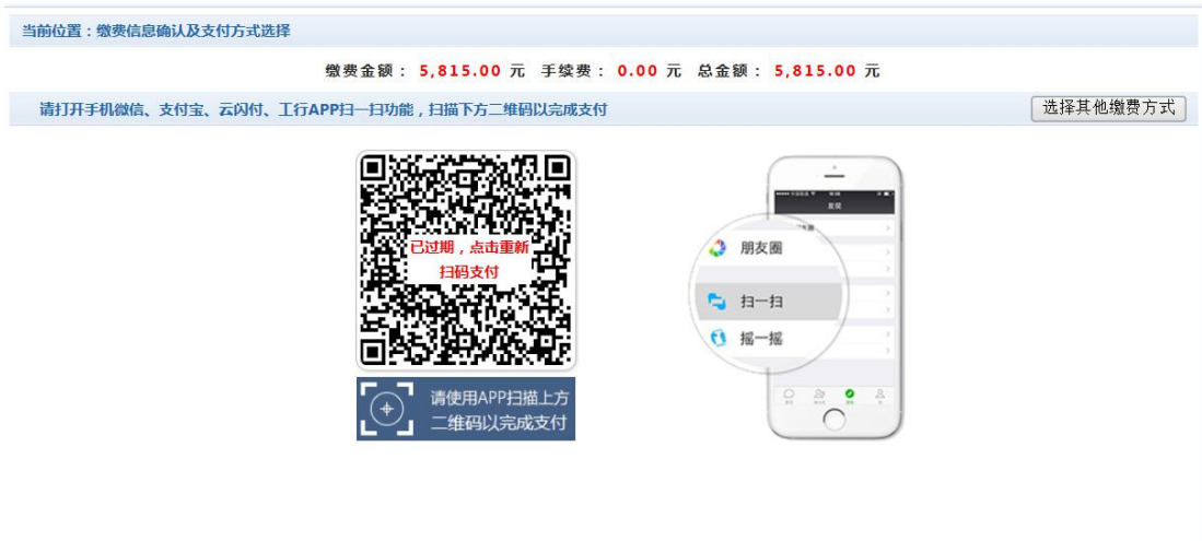
图 3.1-5 网上支付

e. 点击确定缴费后，将会弹出二维码，请使用微信、支付宝、云闪付、工商银行 APP 扫一扫进行扫码支付，如图 3.1-5 所示。 注意：请确认商户名称：潍坊医学院