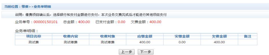
图 3.2-2 业务单费用确认

c. 确认缴费信息。选择缴费金额和缴费方式。如图 3.2-3 所示。点击“业务单明细查看”可查询该业务单支付情况。 注：允许拆分支付时，修改金额时不能小于系统允许的最小支付金额。