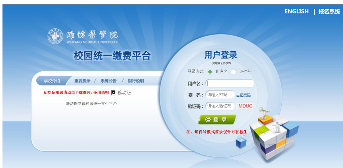
图 1-1 统一支付平台登陆界面

在浏览器地址栏输入 http://tyzfpf.wfmc.edu.cn/xysf/ ，如图 1-1 所示。