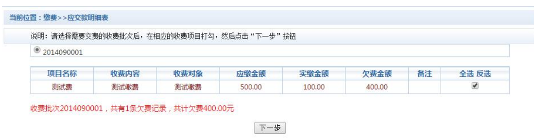
图 3.2-1 其他零星欠费

点击导航栏的“其他缴费”按钮，进入其他零星缴费显示和选择页面，如图 3.2-1 所示。