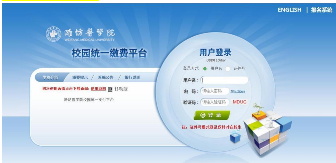
图 1-1 统一支付平台登陆界面

在浏览器地址栏输入 http://tyzfpf.wfmc.edu.cn/xysf/ ， 如图 1-1 所示。